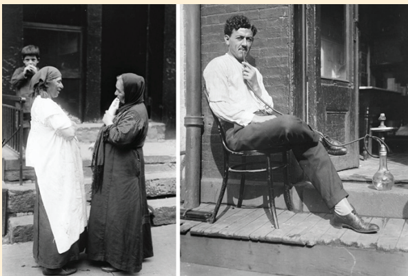
مشاهد من الحياة اليومية للسوريين المهاجرين في حي سوريا الصغيرة.