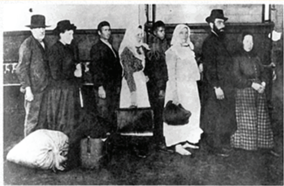
دخول المهاجرين إلى جزيرة إليس (Ellis Island)