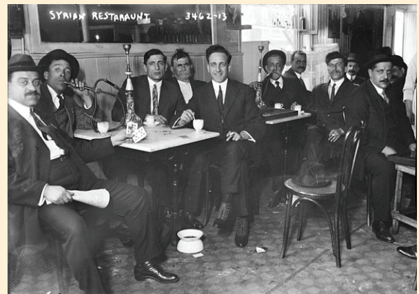
رجال سوريون يدخنون الأرجيلة (الترجييلة)، ١٩١٠-١٩١٥.