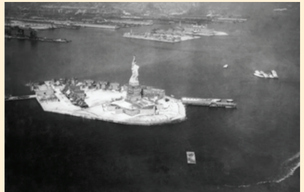
جزيرة إيليس (Ellis Island)

صلّبت على وجهها الشاحب البياض وهي ترى السيّدة الحجريّة تمدّ الشعلة الحجريّة صوبها وتخرج من الضباب الذي يغطي البحر. سمعت صوتاً يقول هذا تمثال الحرّيّة، وهناك وراء الضباب الغريب، هل ترون البنائيات ناطحات السحاب، هذه مدينة نيويورك، انظروا البيوت العالية.