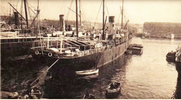
السفينة "لبنان" في ميناء مرسليليا

في مرسليليا، نزلت في فندق يملكه بيروتى وحبلي مناصفة. شرحوا لها أنّها من هنا ستركب القطار عبر الأراضي الفرنسيّة إلى الشمال. ستقطع فرنسا كلّها في القطار حتى تصل إلى المرفأ في مدينة الهافر، ومن هناك تركب الباخرة الأميركيّة.