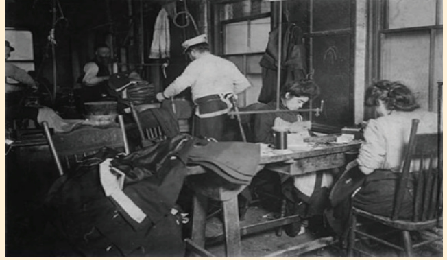
معامل النسيج في نيويورك

معامل هرمان وماكنزي تقع عند طرف الشارع الحادي عشر. كان المبنى يعج، ككفير نحل، بالعملات والعمال طوال النهار وهي قاعدة الى شغلها، وماكينات الخياطة تئز في رأسها. كانت ترجع كالعادة من نهار المعمل الطويل، وأصابعها تؤلمها عند العقد، رقبتهأ أيضاً، وكذلك ظهرها.